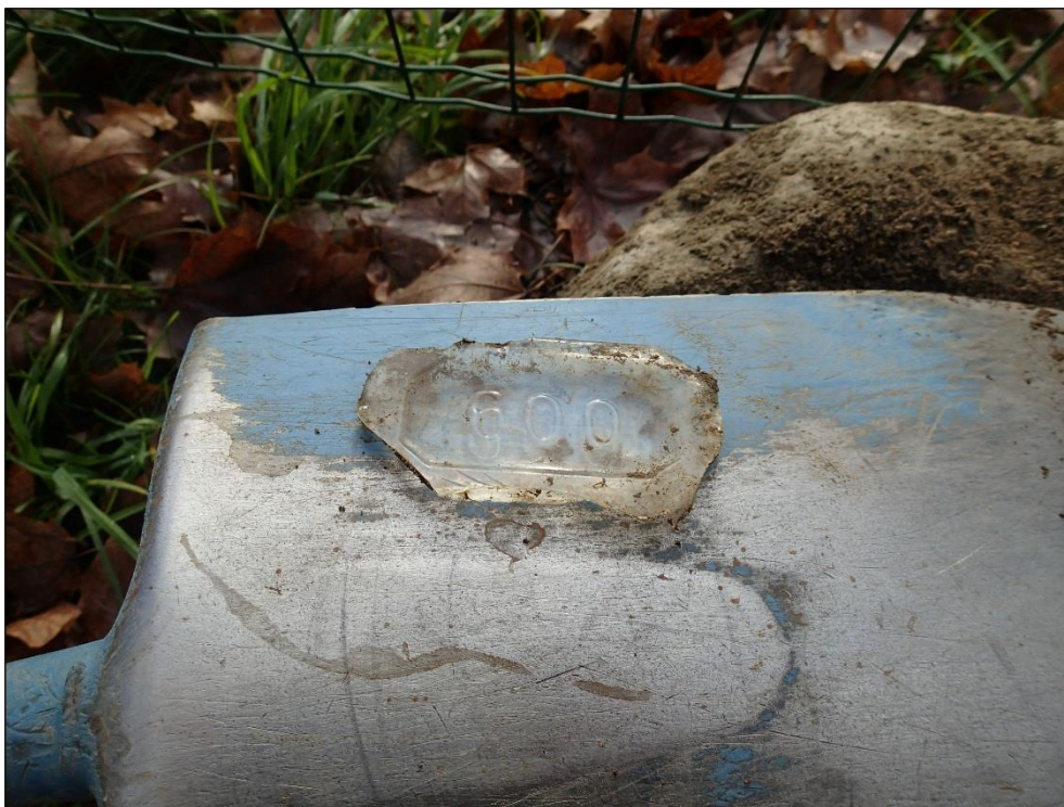
Havaintopisteen 1 kohdalta löytynyt astialasin pala, jossa merkintä "600".