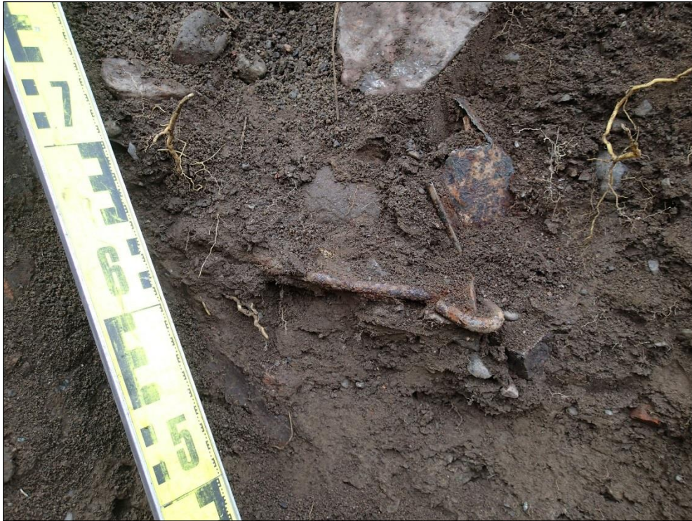
Rautainen haka ja peltiä in situ Y1:ssä kaivon kohdan lounaiskulmassa.