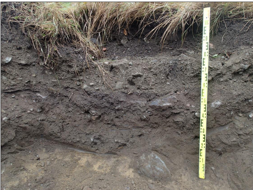
Havainto 2. Kaivon kohdan itäseinämä. Kerrosjärjestys pinnasta lukien: n. 0-40 cm nurmimulta ja hiekkasora, n. 40-45 cm Y1, n. 45-95 cm Y2 ja n. 95-100 cm Y3.