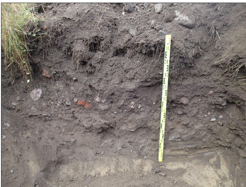
Havainto 2. Kaivon kohdan länsiseinämä. Kerrosjärjestys pinnasta lukien: n. 0-25 cm nurmimulta ja hiekkasora, n. 25-50 cm Y1, n. 50-90 cm Y2 ja n. 90-100 cm Y3.