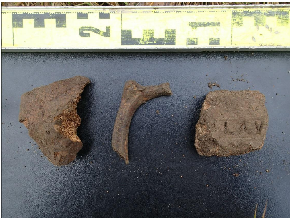
Löytöjä havaintopiste 2:n Y2:sta. Luita ja tiilen kappale, jossa erottuu merkintä "LAV"[...].