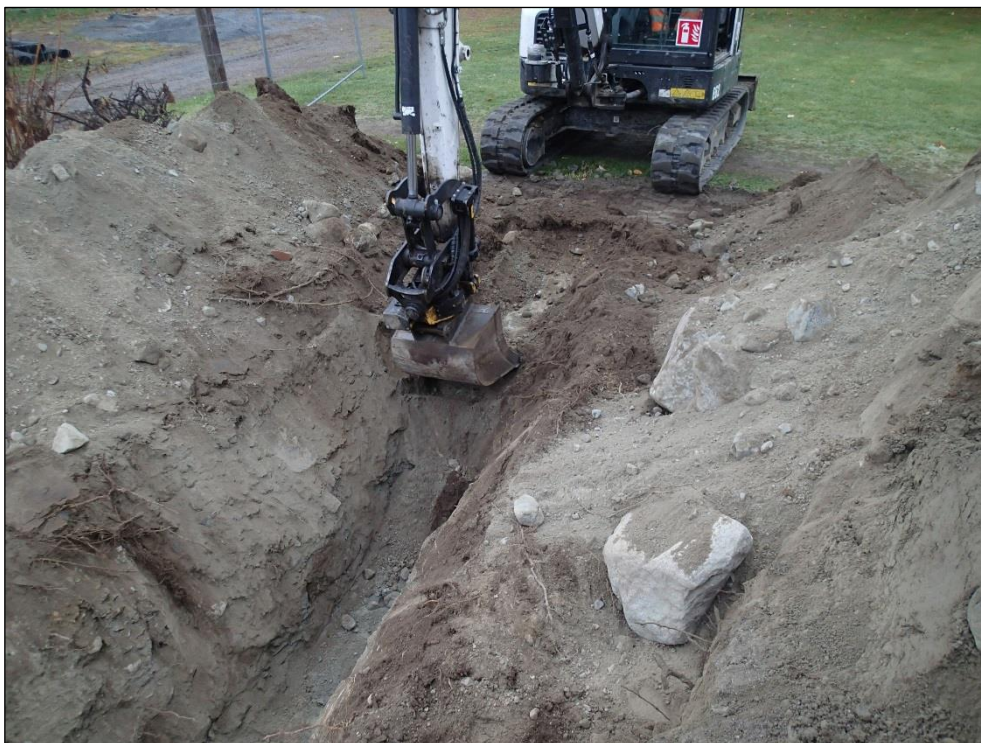
Kaakkoon. Ojaa kaivetaan valvotun osuuden alkupäässä.