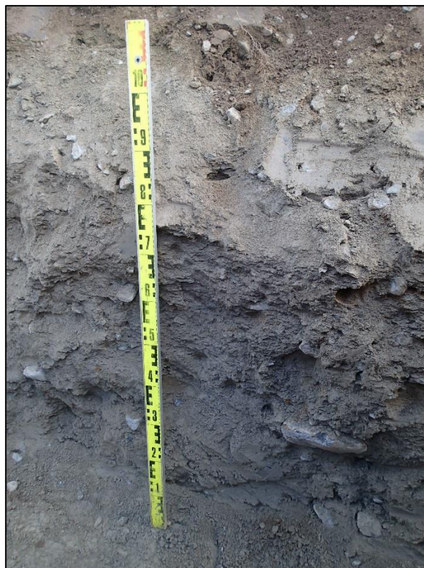
Vasemmalla: Pohjoiseen. Näkymä kaivannon alkupäästä. Oikealla: Kerrostumat samalla kohtaa, pinnaista lukien: n. 0-20 cm sekoittuneita ja puhtaita maanrakennuskerroksia vailla mitään löytöjä ja n. 20-100 cm tiiviiksi pakkaantunut koskematon moreeni, jonka kivet olivat särmikkäitä ja maa vaikutti sisältävän kaikkia raekokoja sorasta saveen.