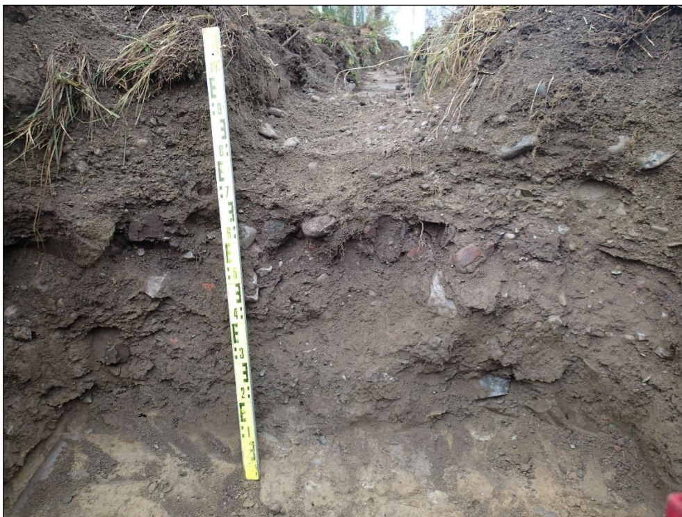
Havaintopiste 2. Kaivon kohdan pohjoisseinämä. Kerrostumat pinnasta lukien: n. 0-15 cm nurmimulta, n. 15-30 cm hiekkasora, josta löytyi betonirauta n. 1 m ennen kaivon kohtaa, 30-50 cm tumma sorahiekka, jossa \varnothing n. 10 cm kiviä, tiilen kappaleita, luita ja liitupiipun katkelma (Y1), n. 50-90 cm edellistä hieman vaaleampi kerros, jossa harvaksen luita, hiiliä ja tiilen kappaleita sekä n. 90-100 cm pohjamaata muistuttava vaalea hietä, jossa kuitenkin esiintyy vielä harvoja hiiliä ja luita (Y3).