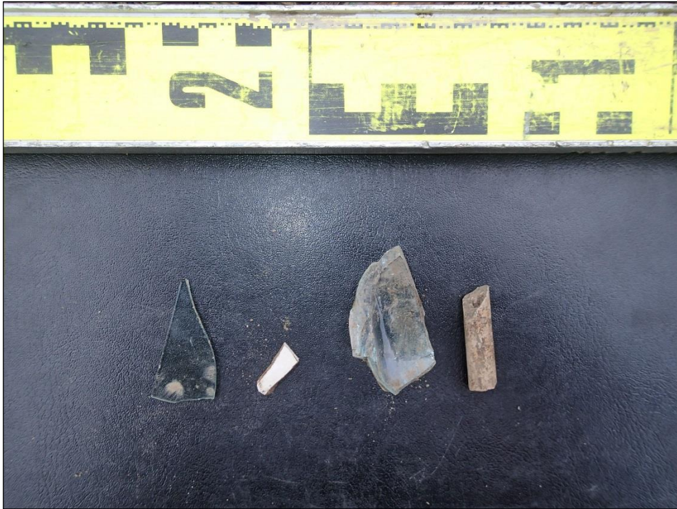
Löytöjä havaintopiste 2:n Y1:stä: Tasolasia, fajanssia, hiekkaan kiinni sulanutta tummanvihreää lasia ja liitupiipun katkelma.