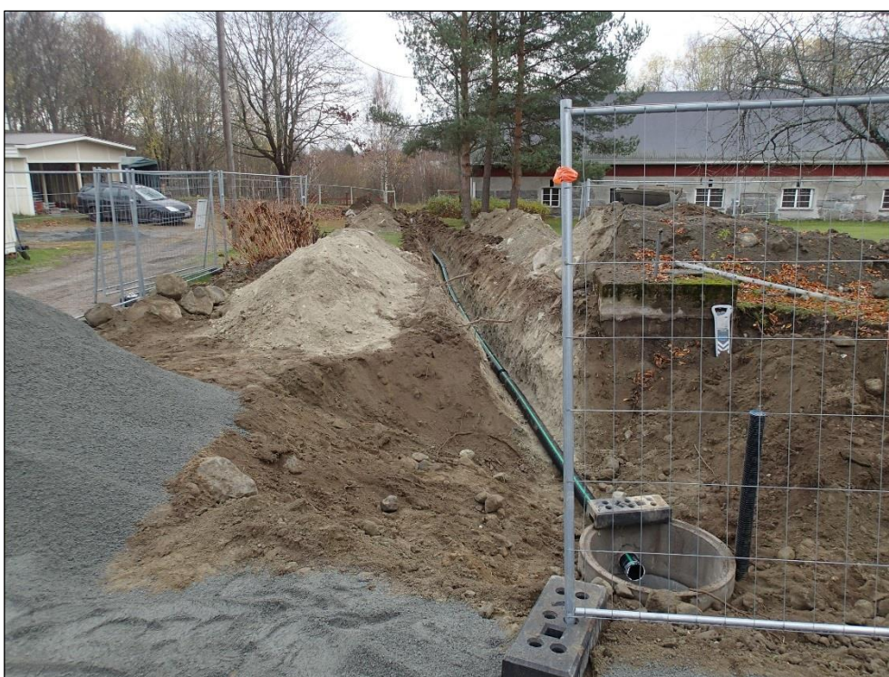
Etelään. Valmis oja alkupäästä katsoen. Etualan kaivo ja sen kuoppa olivat tehty ennen valvontaa.