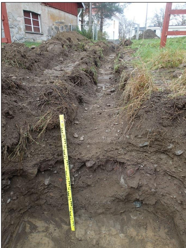
Pohjoiseen. Valmis kaivanto loppupäästään kuvattuna. Etualalla nyt kaivettu kaivon paikka.