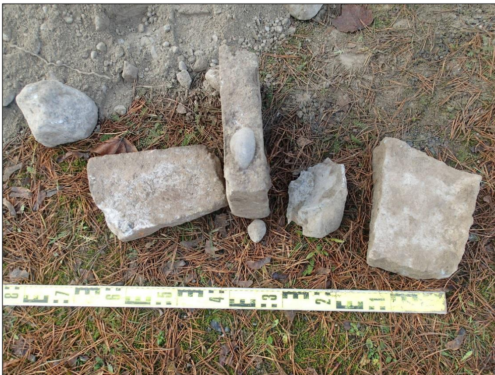
Havaintopisteen 1 kohdalta esiin tulleita betonin kappaleita.