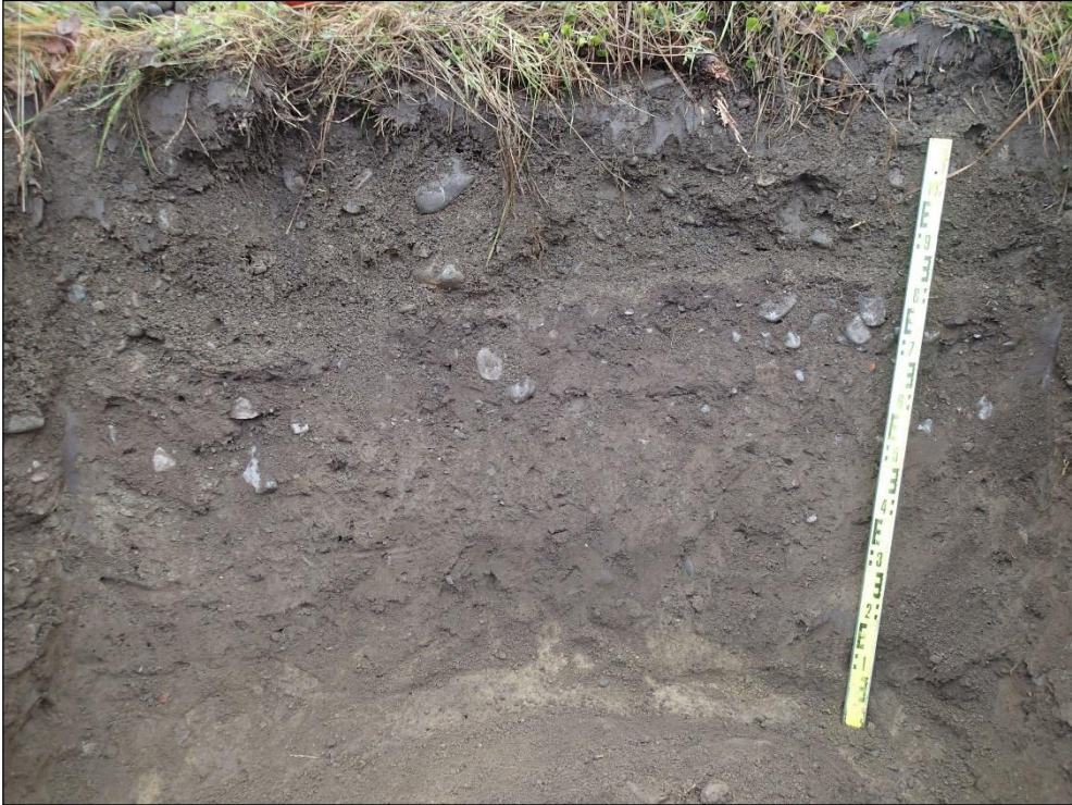
Havainto 2. Kaivon kohdan eteläseinämä. Kerrosjärjestys pinnasta lukien: n. 0-40 cm nurmimulta ja hiekkasora, n. 40-50 cm Y1, n. 50-110 cm Y2 ja n. 110-120 cm Y3.